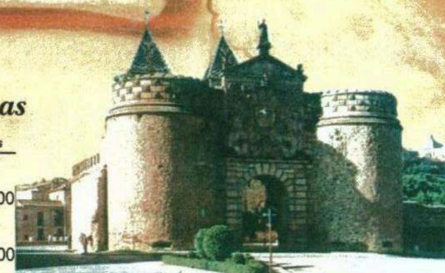
Puerta Bisagra (Toledo)